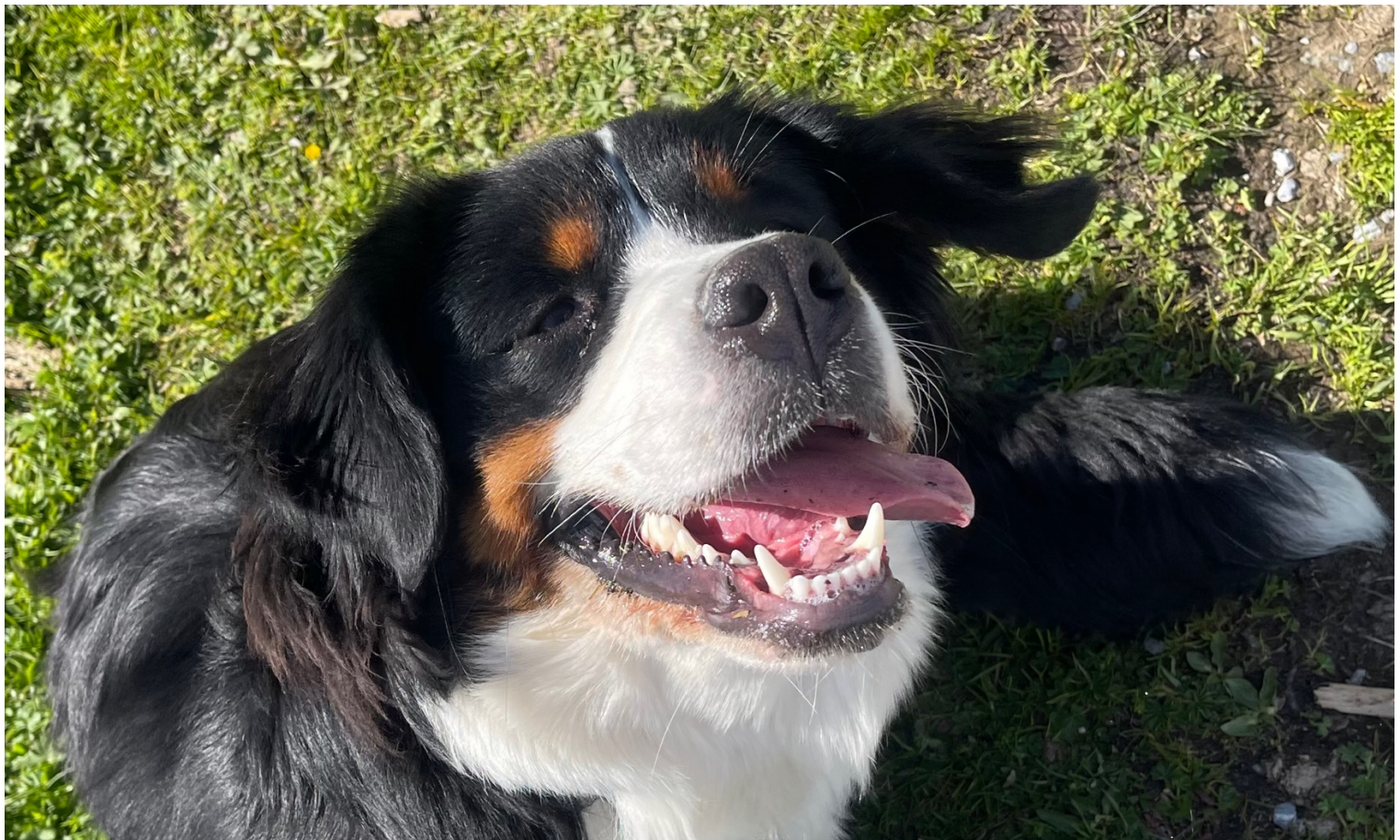
Kleopatra vom Kleinholz