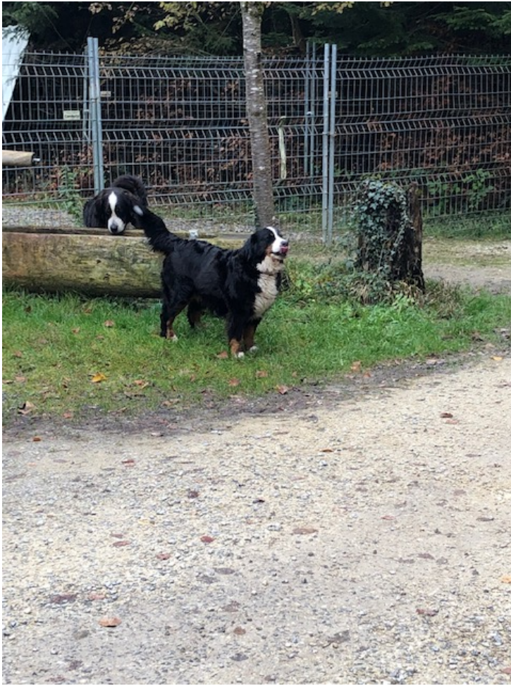
Winnie im Chlee