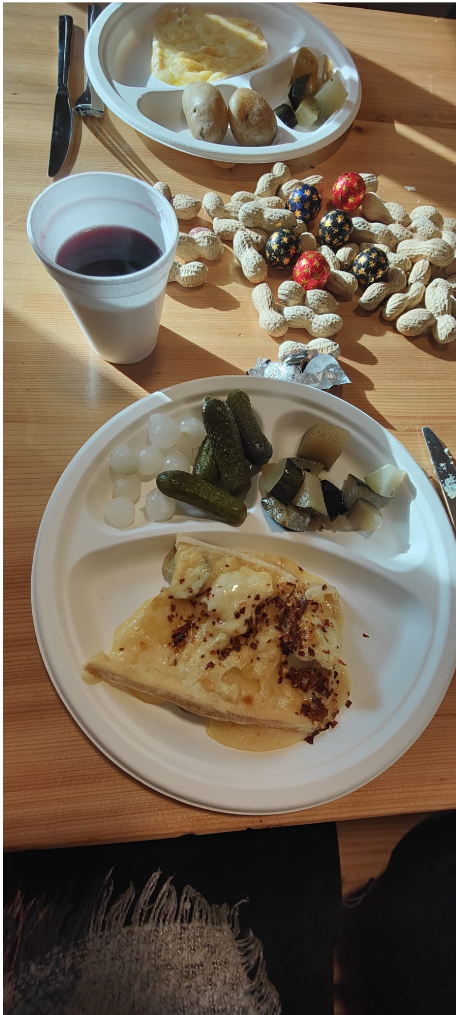
So fein mmmhhhhhhh