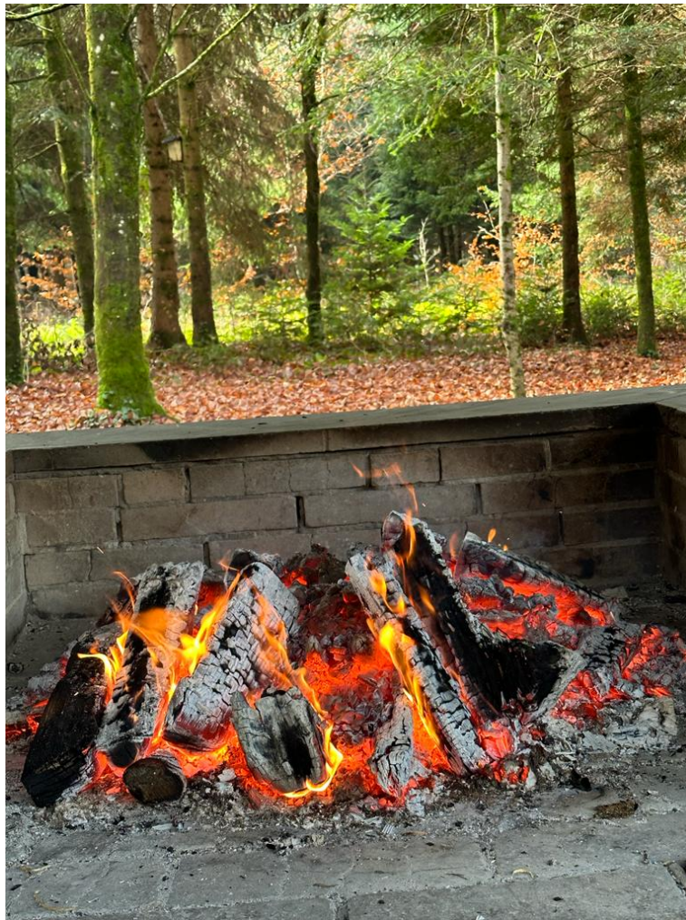
Nach dem Spaziergang erwartet uns ein warmes Feuer und ein feines Apero